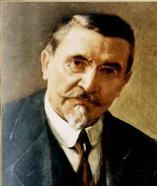
Stevan Stojanović Mokranjac (1856-1914)