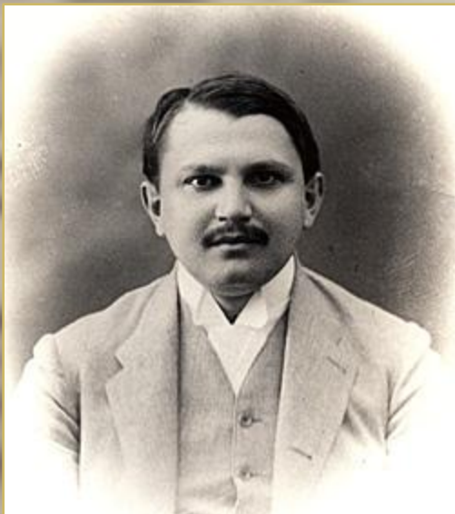
Isidor Bajić (1878-1915)