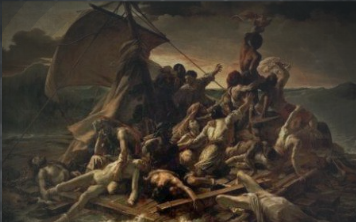
Teodor Žeriko, Splav Meduze , 1818/19, ulje na platnu