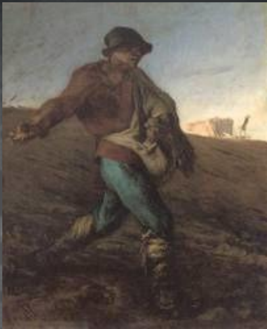
Žan-Fransoa Mile, Sejač, oko 1850, ulje na platnu